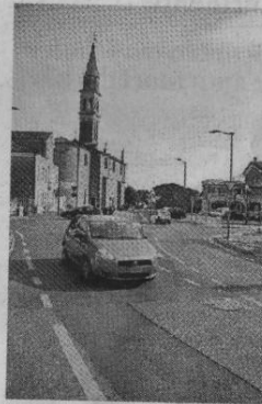
LA SEDE Via Giovanni XXIII dove si trova l'Università Popolare

APERTE LE ISCRIZIONI AL DICIANNOVESIMO ANNO ACCADEMICO C'È TEMPO FINO AL 29 SETTEMBRE